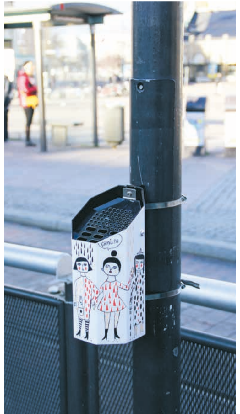
Färg och form fångar fimpen. När hållplatserna fick färgglada och konstnärligt dekorerade askkoppar minskade antalet fimpar på marken.